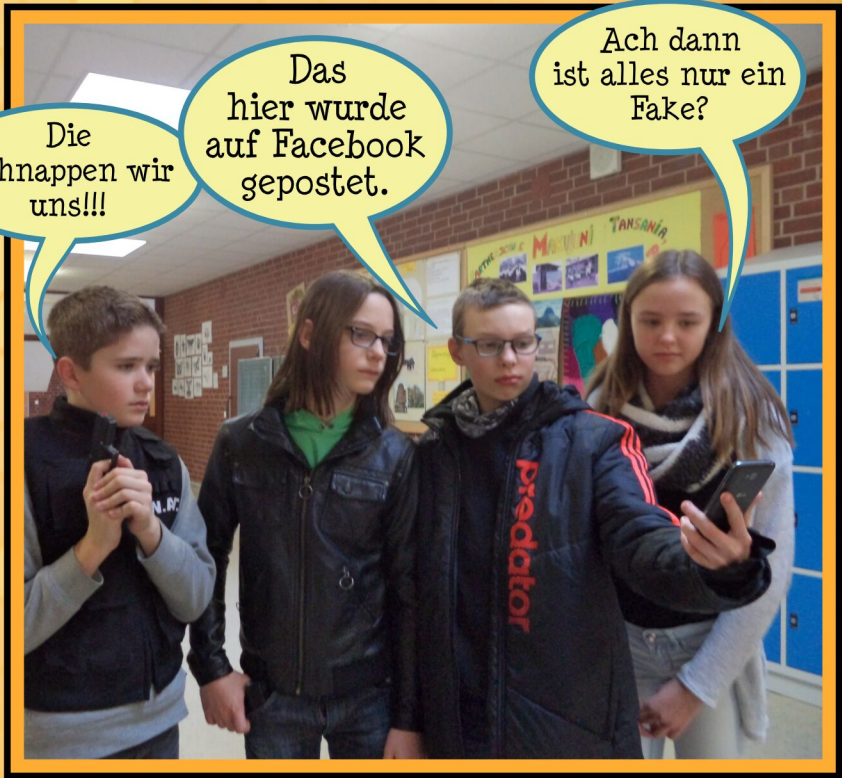
Otto kam aufgeregt zu den Polizisten.