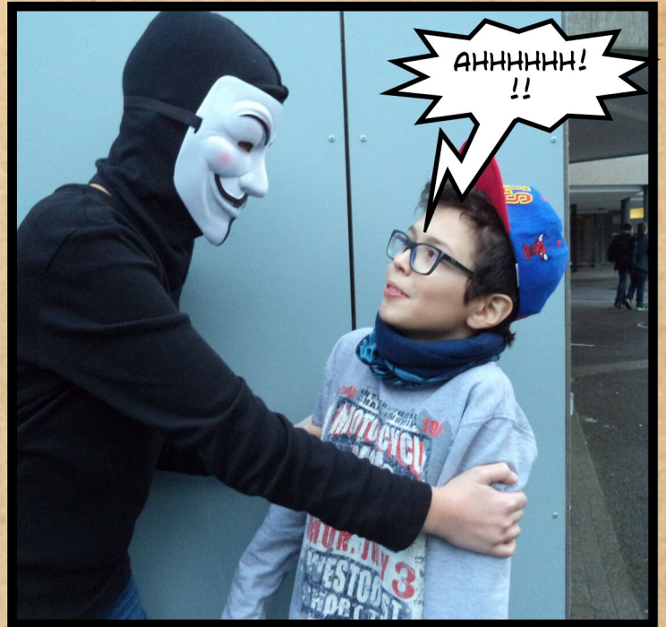
LUCE VERSCHLEPPT ENERS